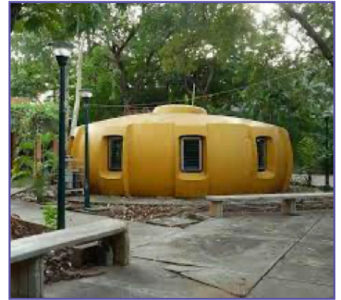
Casa mara (Calabaza).