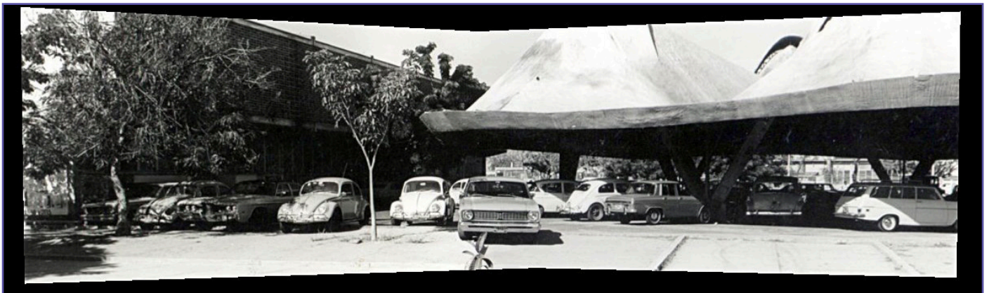
Facultad de Arquitectura (estacionamiento techado). Fuente: Arq. Enrique Catina 1974 aproximadamente

La dedicación de sus autoridades en cada periodo decanal le incorpora valor a la academia y a la calidad ambiental de su infraestructura... se establecen cambios de pensum y el régimen de estudios pasa de anual a semestral ... para entonces EL LUGAR ya tiene equipamiento de obras de arte, colores, texturas, es nuestro espacio articulador -en términos académicos- es el espacio de magia - en términos más de poesía ... donde se identifican como hitos de diferentes épocas desde el estacionamiento techado con cubierta hiperbólica, lugar de infinitas reuniones al lado del carro particular, de celebración de alegres jinkanas, de certámenes para la reina de la facultad, también para esconderse en caso de protestas... El banquito con diseño único hoy rescatado con inspiración en los colores de Mondrian un hito frente a la cooperativa estudiantil, sitio necesario para ubicarse en ratos de dispersión... la placita decanal con escultura de George Broos, con sillas de asbesto que eran de innovación y de comodidad para los estudiantes que llegaban muy temprano en el bus de transporte de LUZ- Ahora, La calabaza toma protagonismo una estructura experimental del Arq. Jorge Castillo se convierte en hito con usos cambiantes en el tiempo... la escultura de Lía Bermúdez ... la estructura vertical sistema modular triangular... todo en armonía para el encuentro.