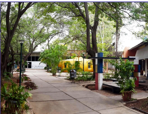
El lugar de la magia (patio central de la FAD LUZ).