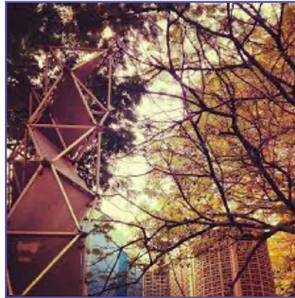
Estructura modular triangular.