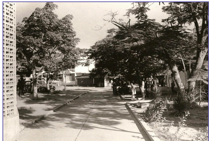
Plaza central de la Facultad de Arquitectura. Aproximadamente 1977-1978