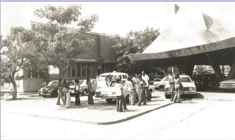
Facultad de Arquitectura. Fuente: Archivos FAD LUZ 1978 fecha aproximada

...pero continuemos en la línea del tiempo y los periodos decanales se suscitan con 13 decanos, según orden cronológico