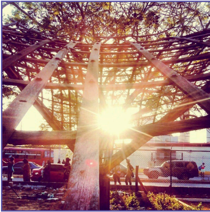
Paraboloide hiperbólico.