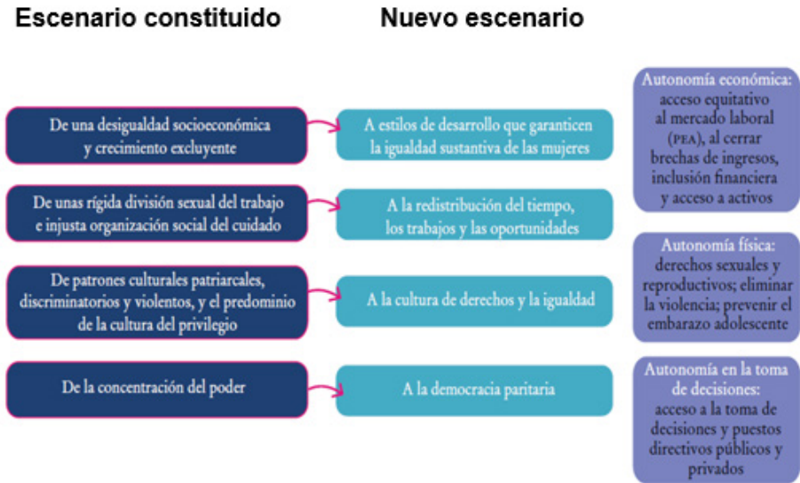
Diagrama 1 De la desigualdad a la autonomía